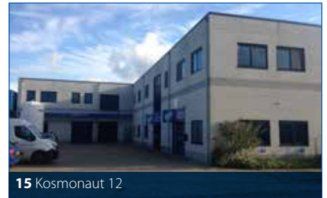
15 Kosmonaut 12