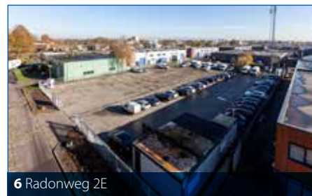
6 Radonweg 2E