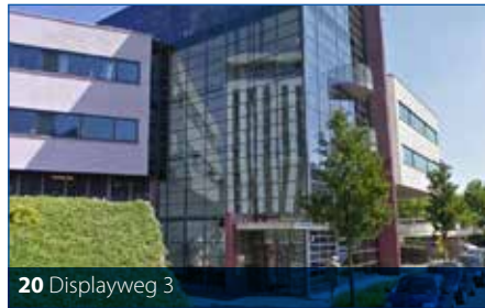
20 Displayweg 3