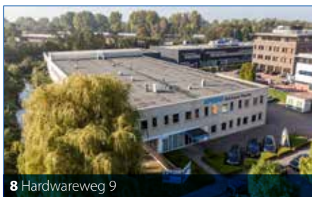
8 Hardwareweg 9