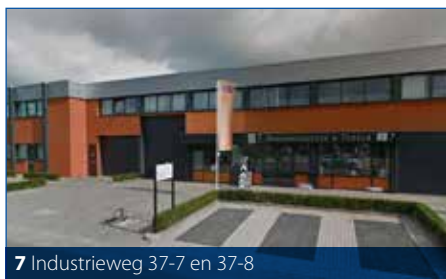
7 Industrieweg 37-7 en 37-8