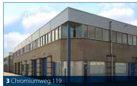
3 Chromiumweg 119