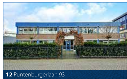
12 Puntenburgerlaan 93