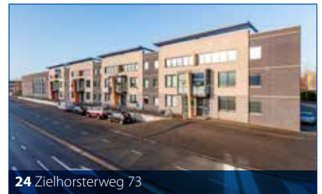
24 Zielhorsterweg 73

13: Hellestraat 35 Circa 114 m 2 winkelruimte is verhuurd aan Schiesser. Schiesser maakt al meer dan een eeuw ondermode. Een goed bereikbare winkel in Amersfoort Centrum. Binnen 2 weken was dit pand verhuurd!