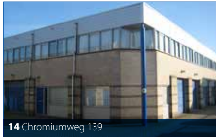
14 Chromiumweg 139