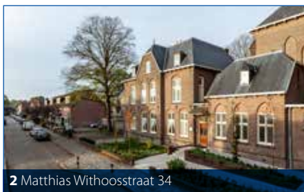
2 Matthias Withoosstraat 34