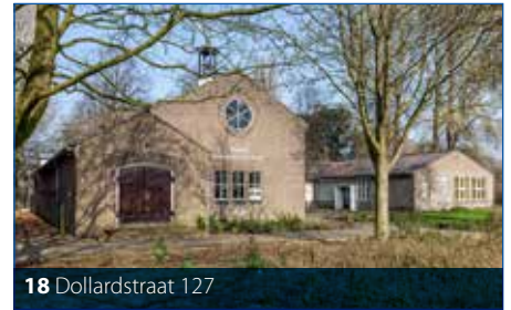
18 Dollardstraat 127