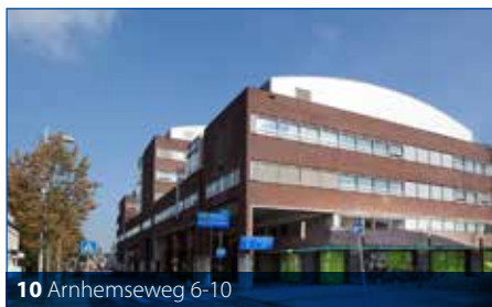
10 Arnhemseweg 6-10