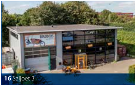
16 Saljoet 3