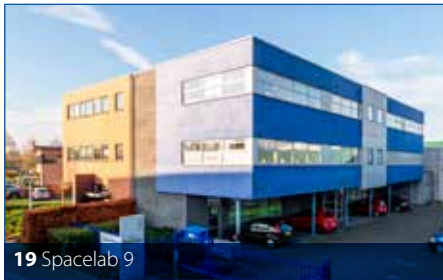
19 Spacelab 9