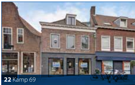
22 Kamp 69