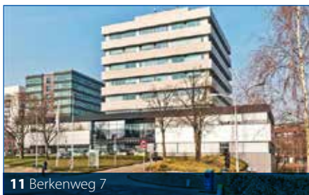
11 Berkenweg 7