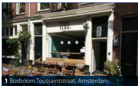
1 Bosboom Toussaintstraat, Amsterdam