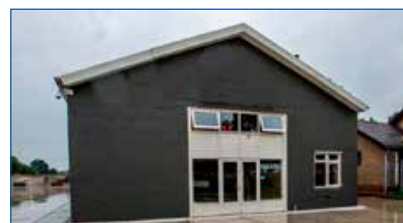
3 Stoutenburgerlaan 17b - Stoutenburg Noord