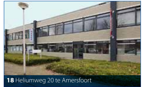
18 Heliumweg 20 te Amersfoort