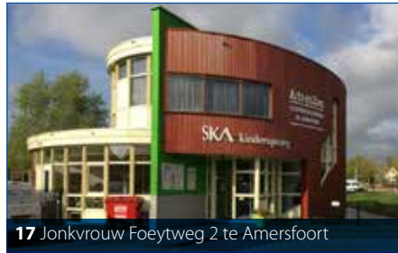
17 Jonkvrouw Foeytweg 2 te Amersfoort