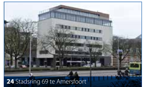
24 Stadsring 69 te Amersfoort