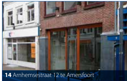
14 Arnhemsestraat 12 te Amersfoort