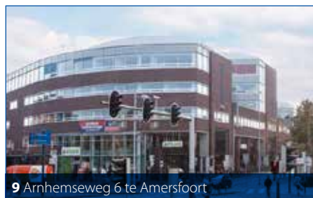
9 Arnhemseweg 6 te Amersfoort