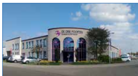
1 Galvanistraat 23 te Nijkerk