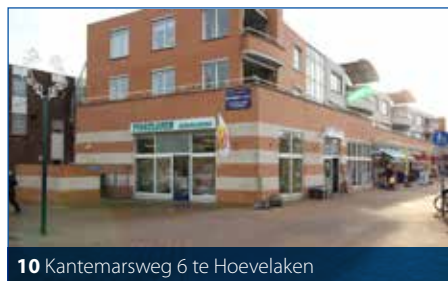
10 Kantemarsweg 6 te Hoevelaken