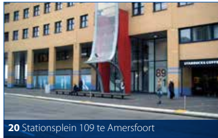
20 Stationsplein 109 te Amersfoort