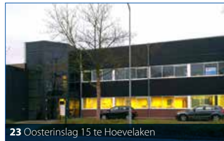
23 Oosterinslag 15 te Hoevelaken