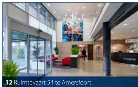
12 Ruimtevaart 54 te Amersfoort