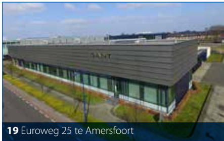
19 Euroweg 25 te Amersfoort