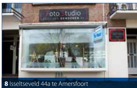
8 Isseltseveld 44a te Amersfoort