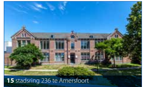
15 stadsring 236 te Amersfoort