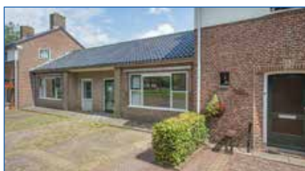
2 Van Aalstplein 3 te Hoevelaken