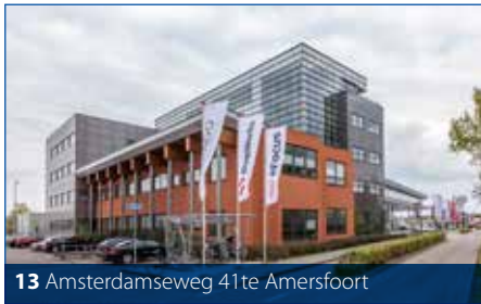
13 Amsterdamseweg 41 te Amersfoort