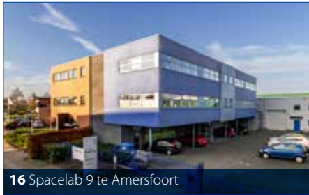
16 Spacelab 9 te Amersfoort