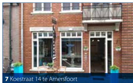
7 Koestraat 14 te Amersfoort