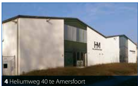
4 Heliumweg 40 te Amersfoort