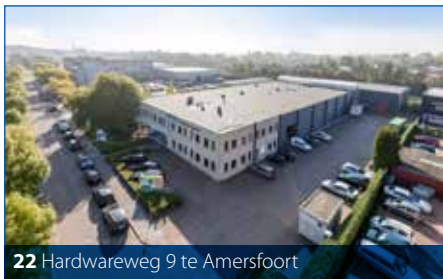
22 Hardwareweg 9 te Amersfoort