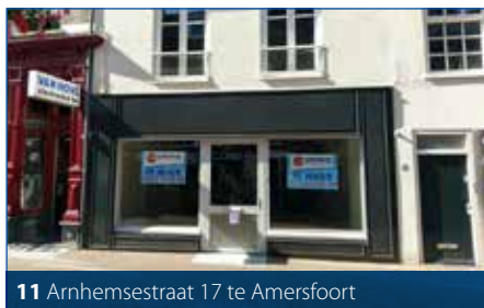
11 Arnhemsestraat 17 te Amersfoort