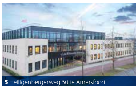
5 Heiligenbergerweg 60 te Amersfoort