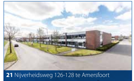
21 Nijverheidsweg 126-128 te Amersfoort